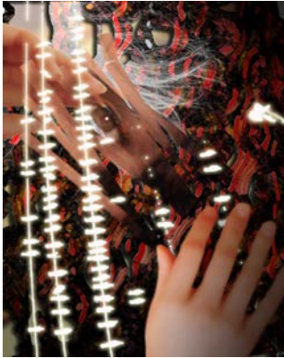
شكل ( 8 ) تصميم رقمي