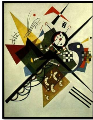
شكل ( 11 ) م ( 11 ) تصميم يدوي