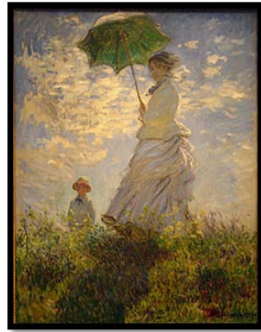
شكل ( 3 ) م ( 9 ) تصميم يدوي