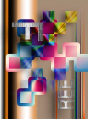
شكل ( 6 ) تصميم رقمي