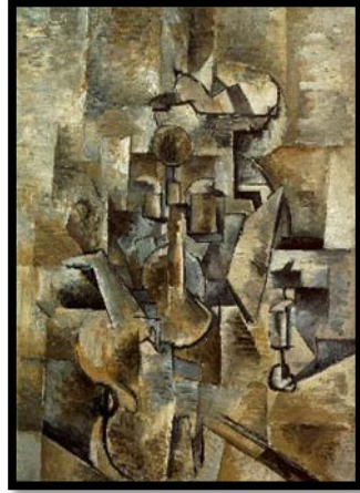
شكل (1) م ( 12 ) تصميم يدوي