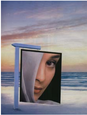
شكل ( 4 ) تصميم رقمي