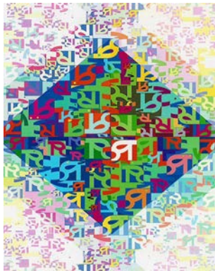
شكل ( 8 ) تصميم رقمي