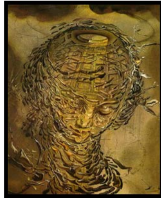
شكل ( 7 ) م ( 10 ) تصميم يدوي