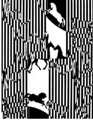
شكل ( 6 ) تصميم رقمي