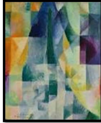
شكل (5) م ( 10 ) تصميم يدوي